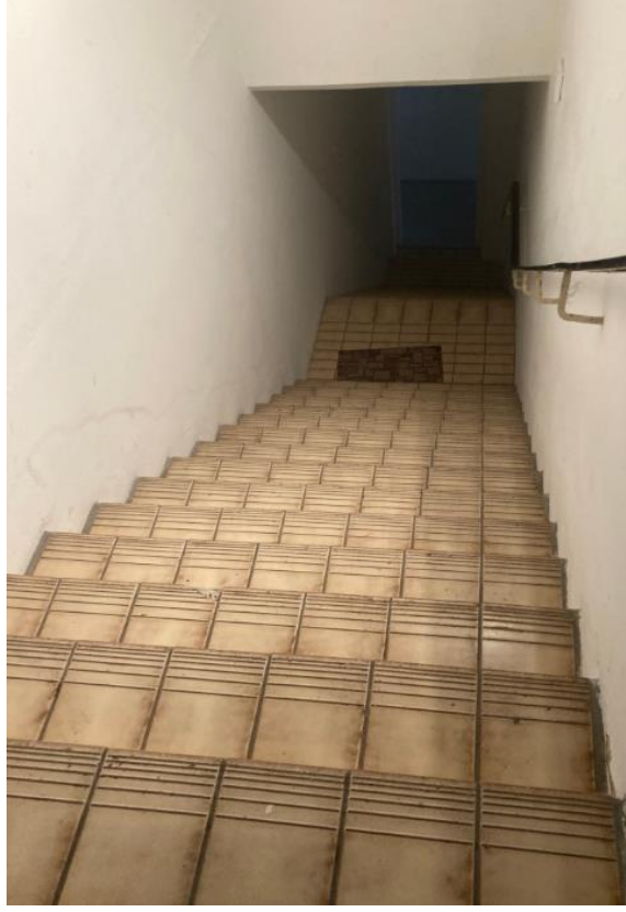
Außenraum & Zugang